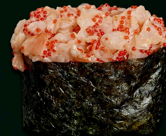
* Тигрова креветка Tiger shrimp