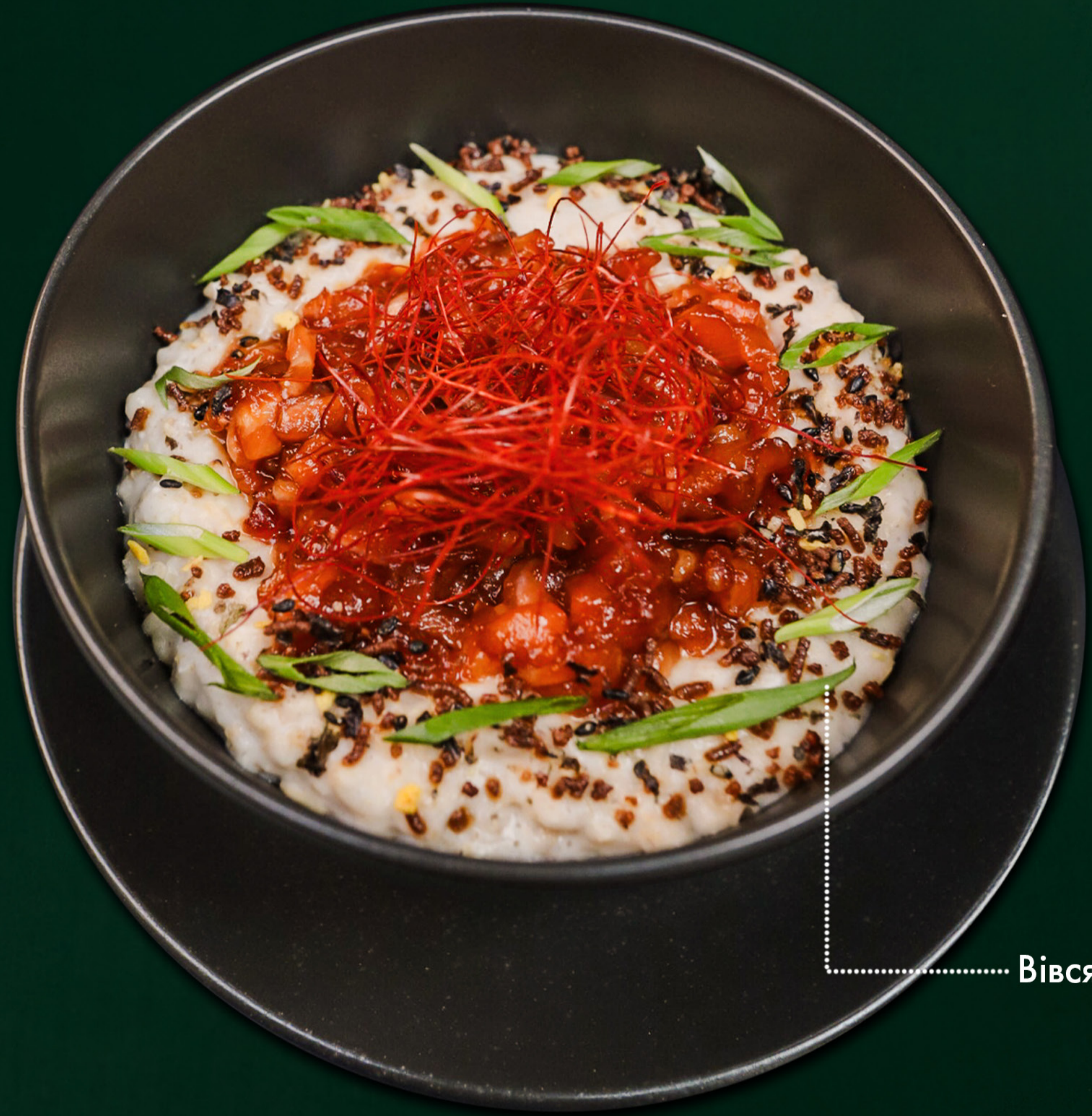
Вівсянка з лососем