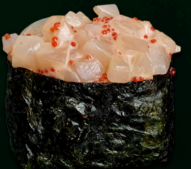
Морський гребінець Scallop