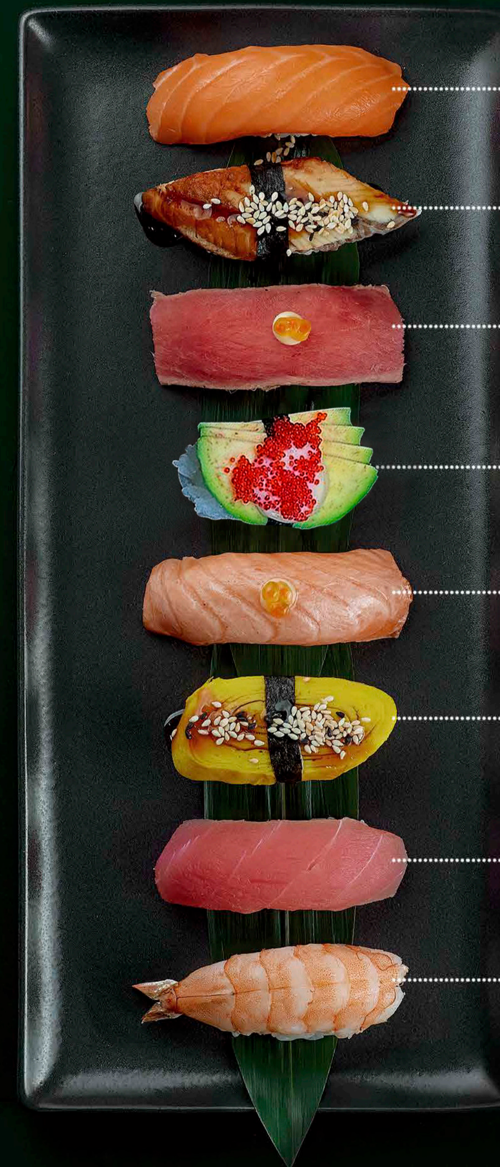
Лосось Salmon 35 гр./gr. 150 ₴