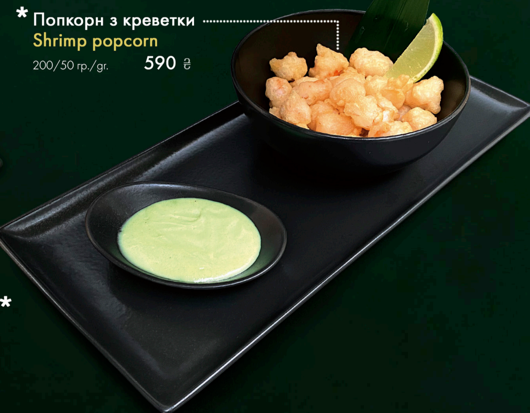
* Попкорн з креветки Shrimp popcorn 200/50 гр./gr. 590 ₴