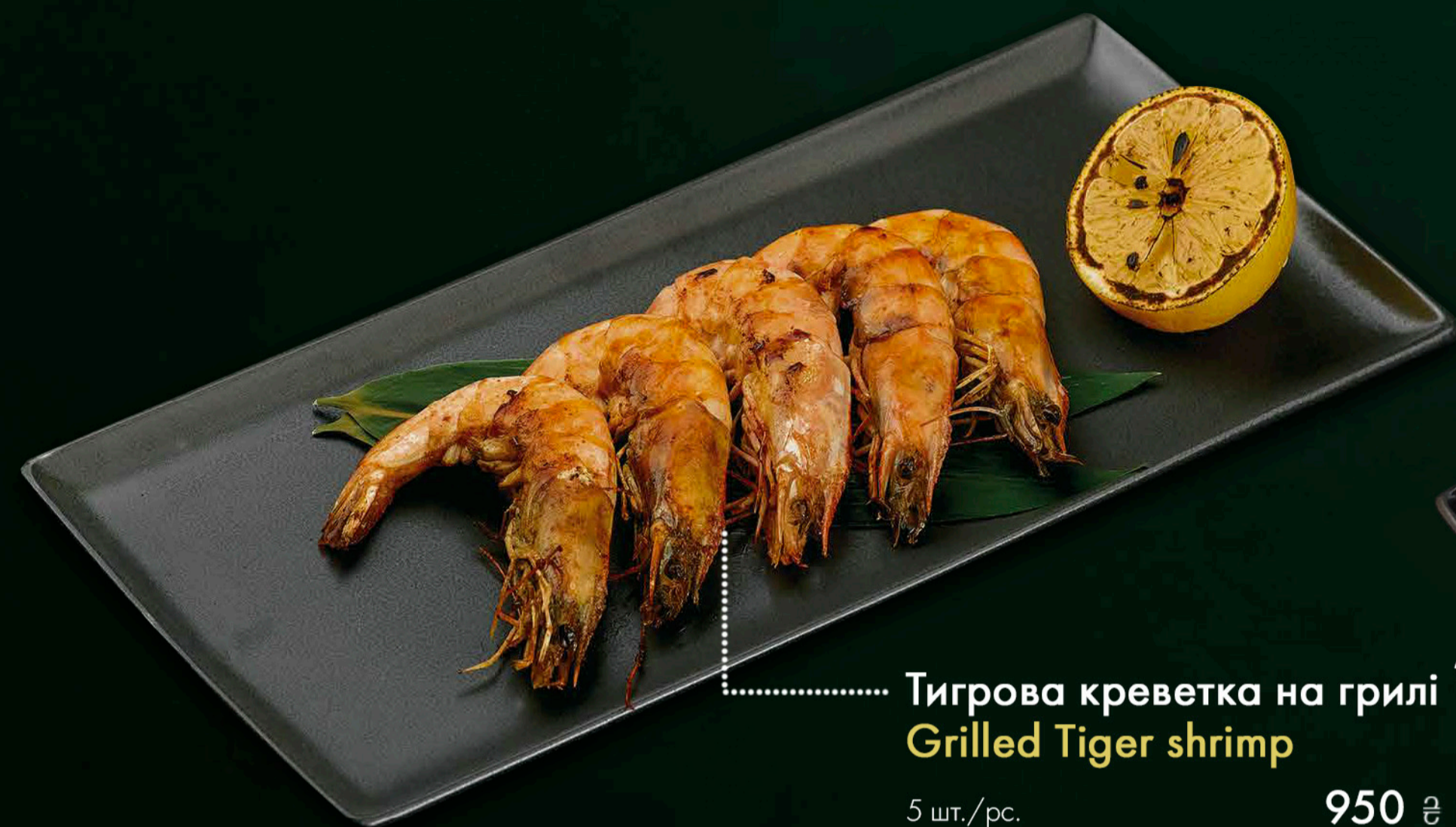
* Тигрова креветка на грилі * Grilled Tiger shrimp 5 шт./pc. 950 ₴