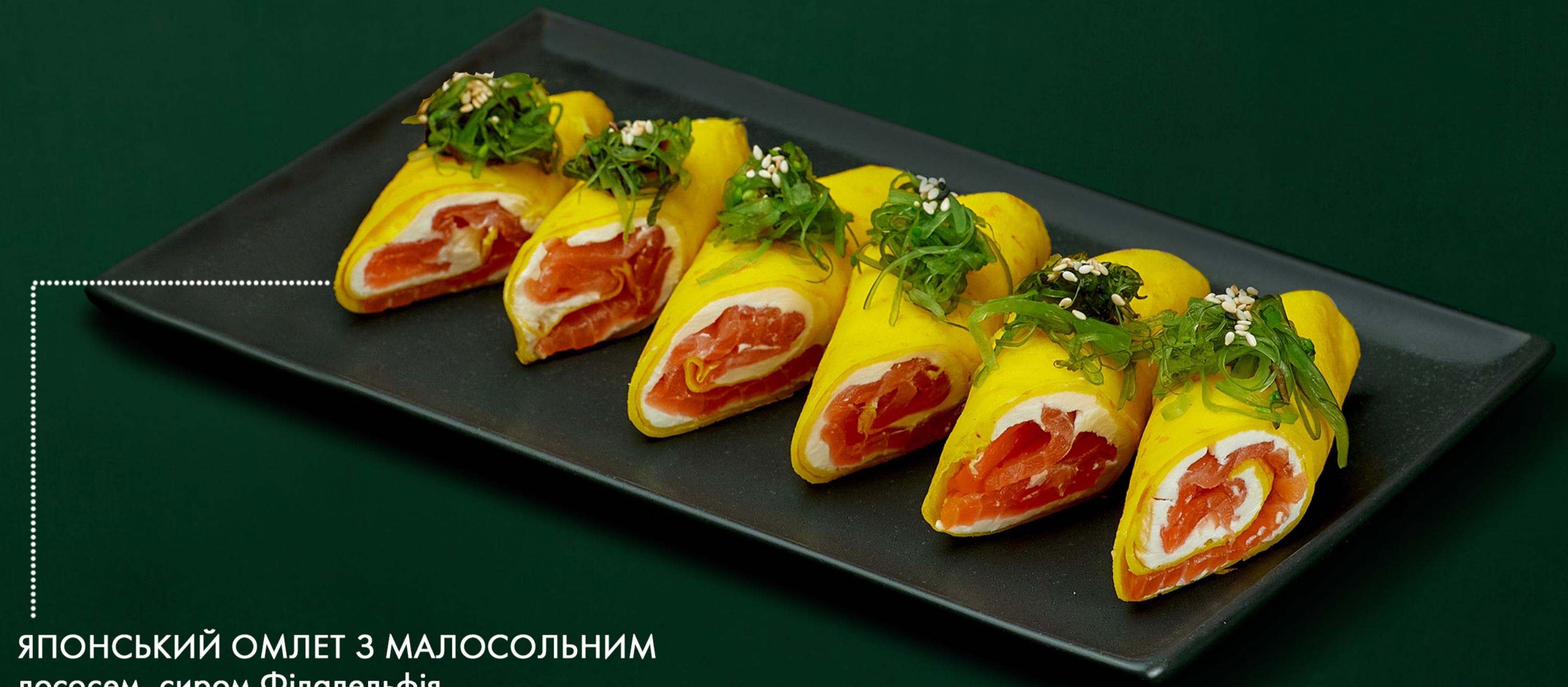
ЯПОНСЬКИЙ ОМЛЕТ З МАЛОСОЛЬНИМ ЛОСОСЕМ, СИРОМ ФІЛАДЕЛЬФІЯ І ХІЯШІ ВАКАМЕ Japanese omelet with low-salt salmon, Philadelphia cheese and Hiyashi Wakame