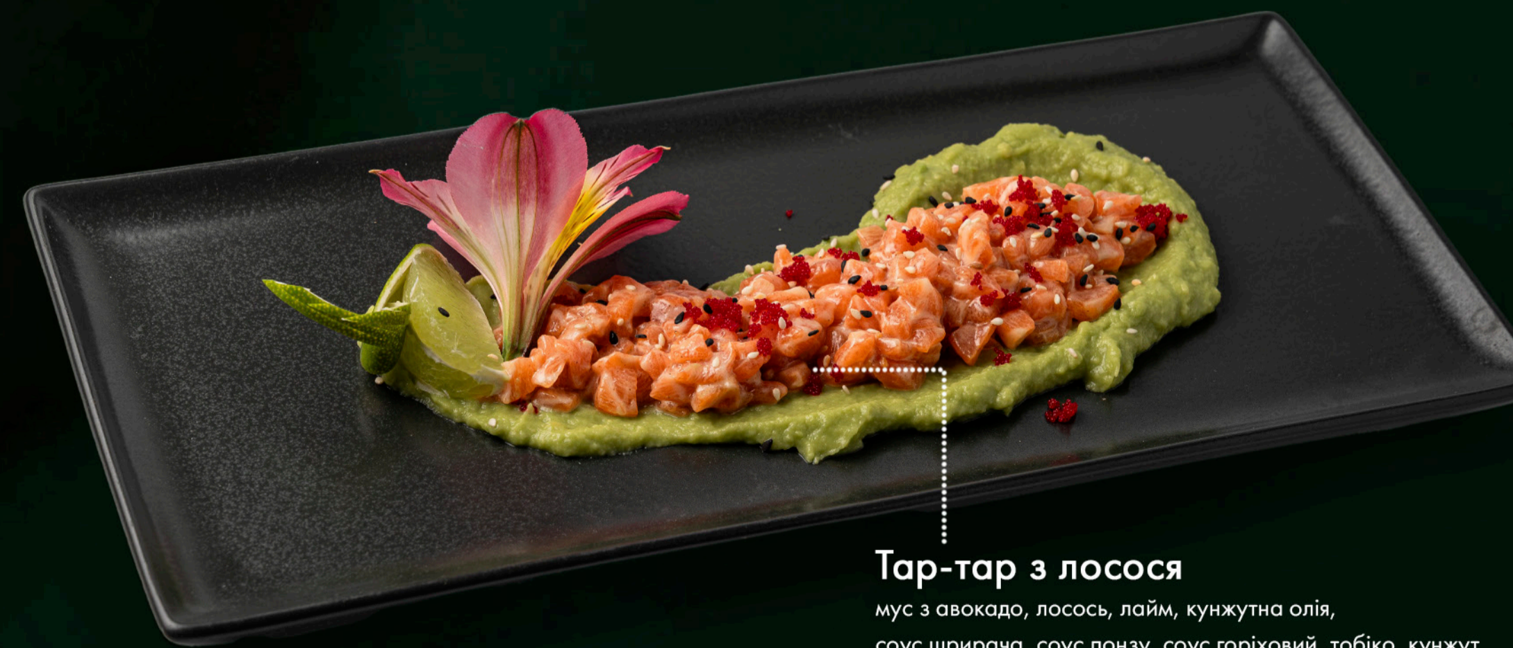
Тар-тар з лосося мус з авокадо, лосось, лайм, кунжутна олія, соус шрирача, соус понзу, соус горіховий, тобіко, кунжут Salmon tartare avocado mousse, salmon, lime, sesame oil, sriracha sauce, ponzu sauce, nut sauce, tobiko, sesame 170 гр./gr. 650 ₴