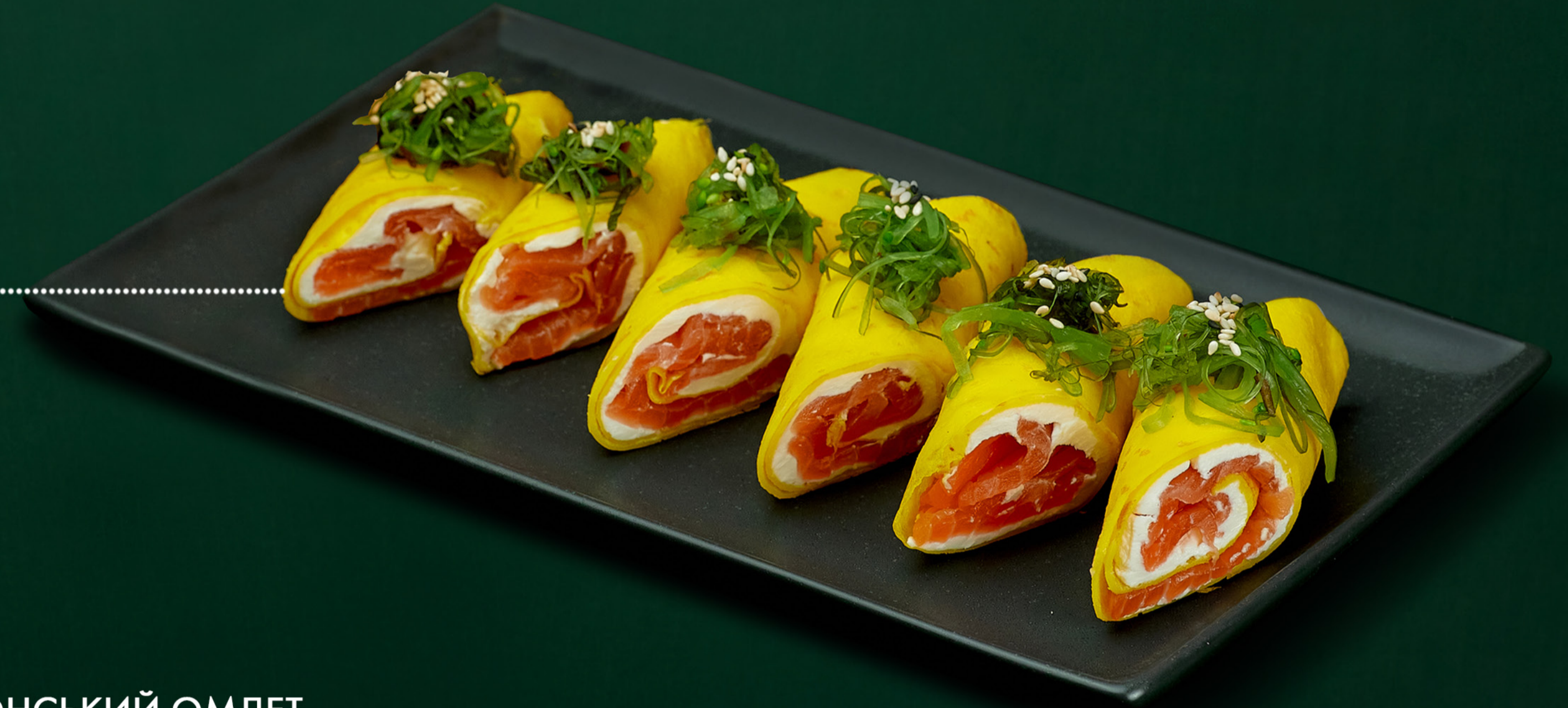
ЯПОНСЬКИЙ ОМЛЕТ з малосольним лососем, сиром Філадельфія і Хіяші Вакаме Japanese omelet with low-salt salmon, Philadelphia cheese and Hiyashi Wakame