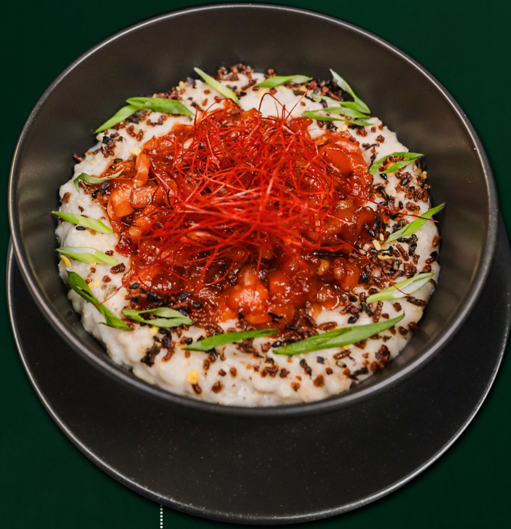
Вівсянка з лососем