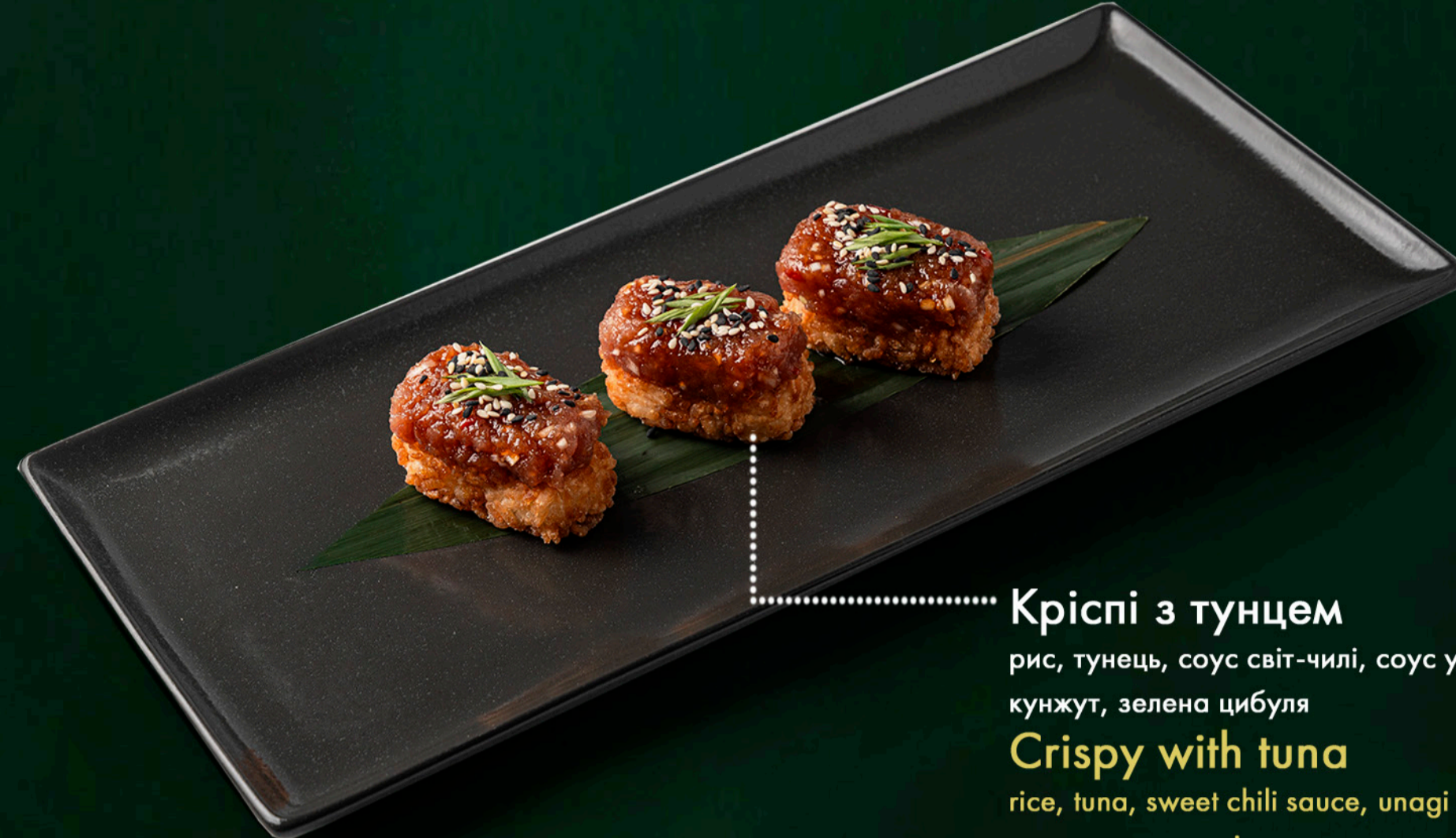
Кріспі з тунцем рис, тунець, соус світ-чолі, соус унагі, кунжут, зелена цибуля Crispy with tuna rice, tuna, sweet chili sauce, unagi sauce, sesame, green onion 190 гр./gr. 330 ₴