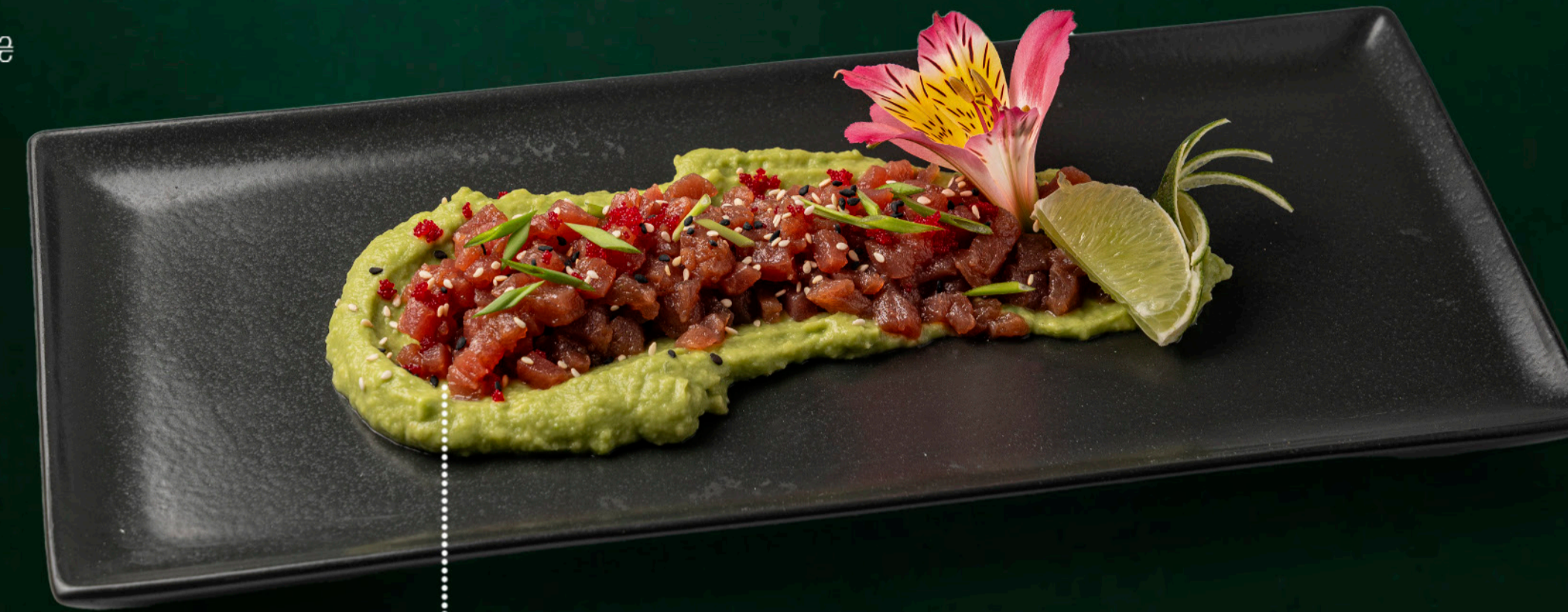
Тар-тар з тунця мус з авокадо, тунець, лайм, кунжутна олія, соус шрирача, соус понзу, соевий соус, корінь імбиру, тобіко, кунжут Tuna tartare avocado mousse, tuna, lime, sesame oil, sriracha sauce, ponzu sauce, soy sauce, ginger root, tobiko, sesame 170 гр./gr. 710 ₴