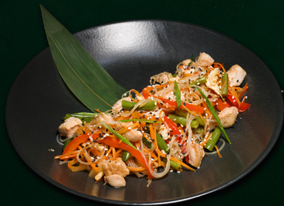
Фунчо́за з куркою Funchoza with shrimp 325 гр./гр. 490 ₴