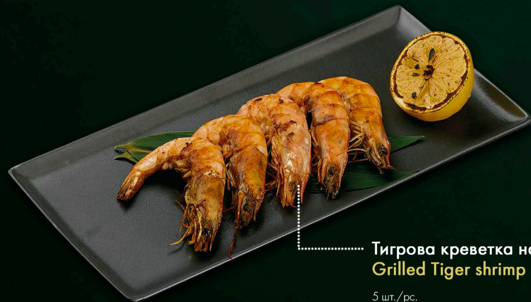
* Тигрова креветка на грилі * Grilled Tiger shrimp 5 шт./pc. 950 ₴