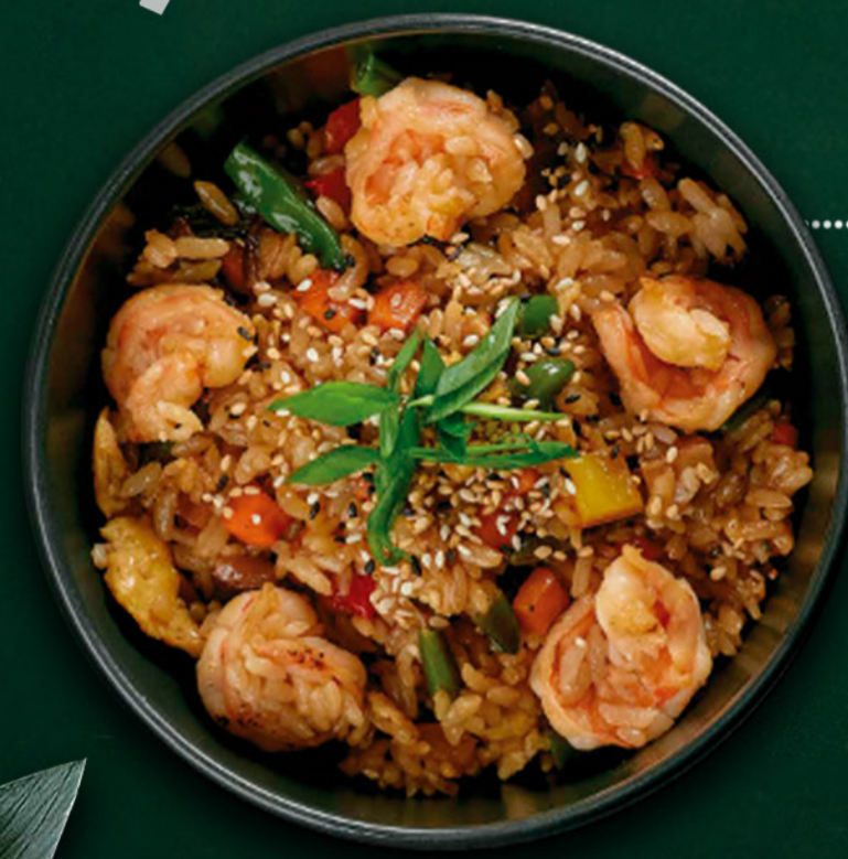
* Рис з овочами вок і тигровими креветками Rice with wok vegetables and tiger shrimps 220 гр./гр. 550 ₴