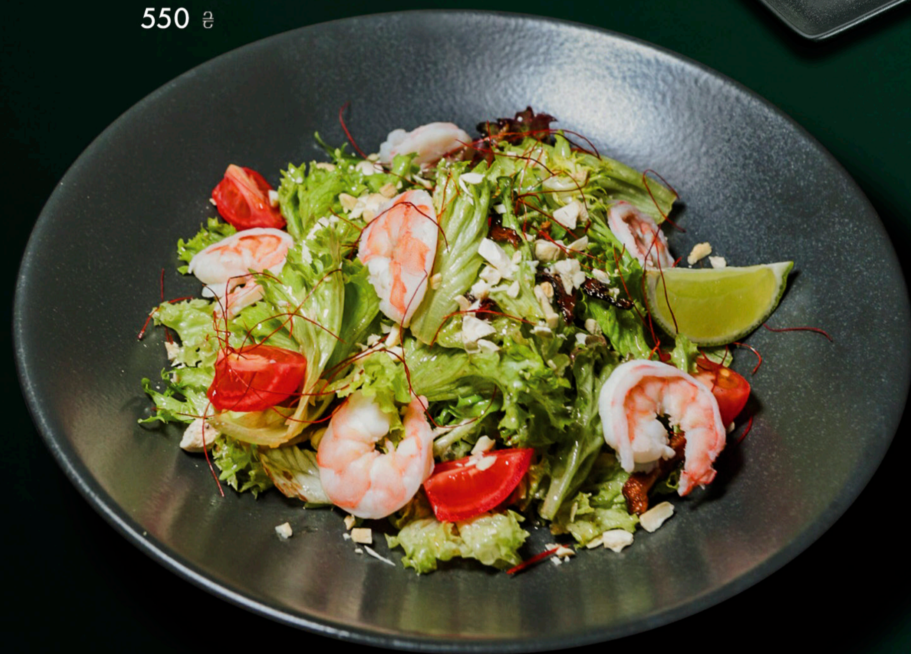
Тобіко Сарада Сніжний краб, огірок, авокадо, тобіко, японський майонез Tobiko Sarada Snow crab, cucumber, avocado, tobiko, Japanese mayonnaise