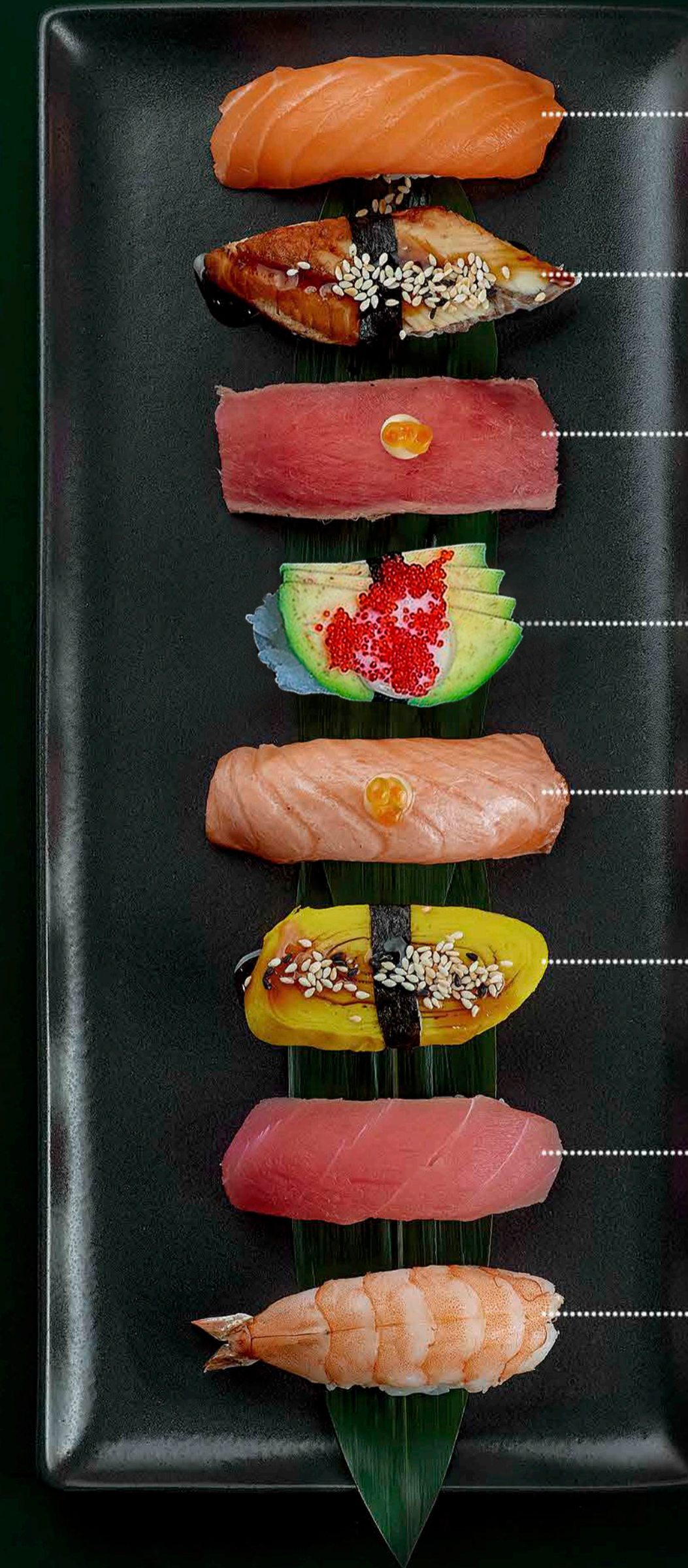
Лосось Salmon 35 гр./gr. 150 ₴