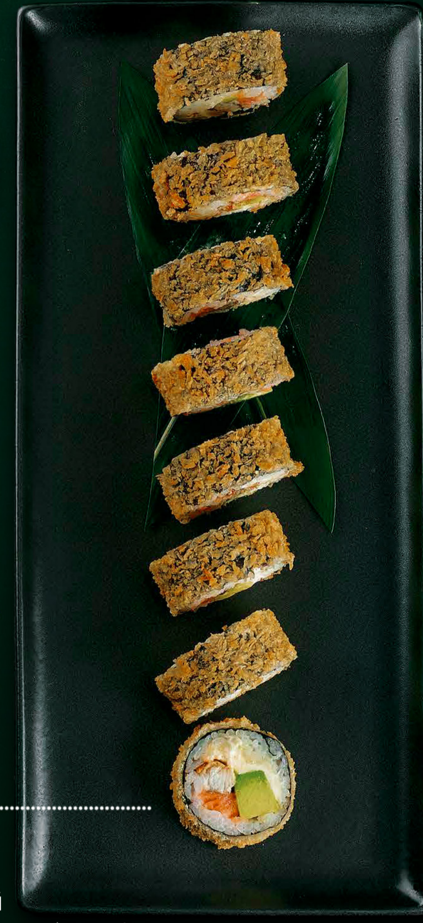
Банзай Вугор, лосось, сир Філадельфія, огірок, авокадо Banzai Eel, salmon, Philadelphia cheese, cucumber, avocado 410 гр./гр. 590 ₴