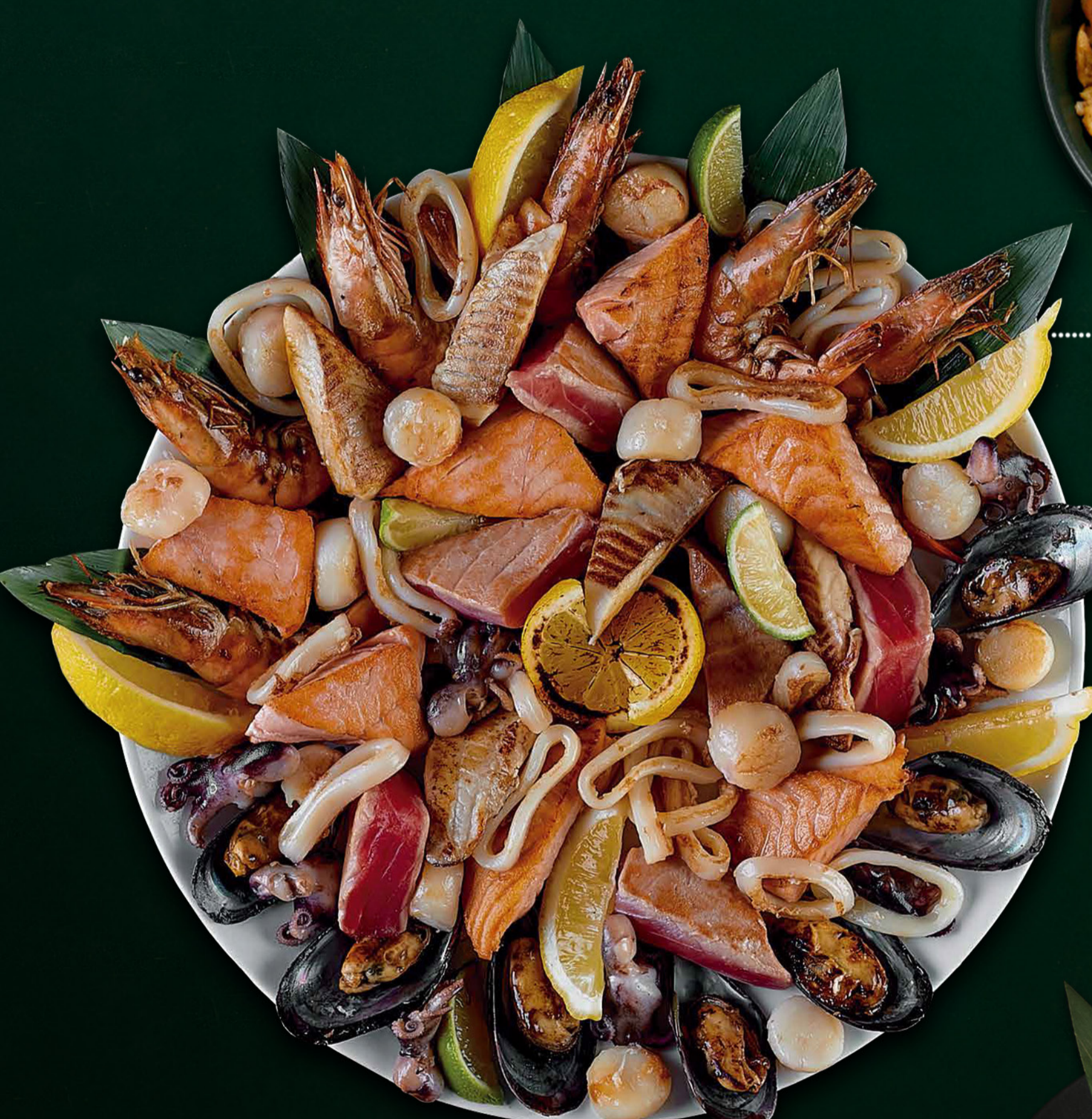
* Асорті на грилі з риби і морепродуктів Лосось, тунець, морський окунь, кальмар, морський гребінець, тигрова креветка, бейбі восьминіг, мідія Grilled fish and seafood platter Salmon, tuna, sea bass, squid, scallop, tiger shrimp, baby octopus, mussel 1500/200 гр./гр. 8900 ₴