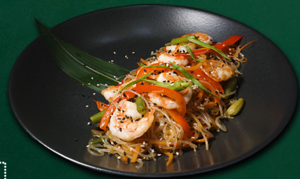
Фунчо́за з креветкою * Funchoza with shrimp 325 гр./гр. 650 ₴