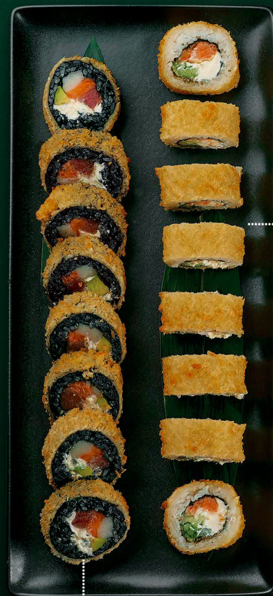
Філадельфія ХОТ Лосось, сир Філадельфія, огірок, яйце куряче, сухарі Панко Philadelphia hot Salmon, Philadelphia cheese, cucumber, chicken egg, Panko breadcrumbs 360 гр./гр. 490 ₴