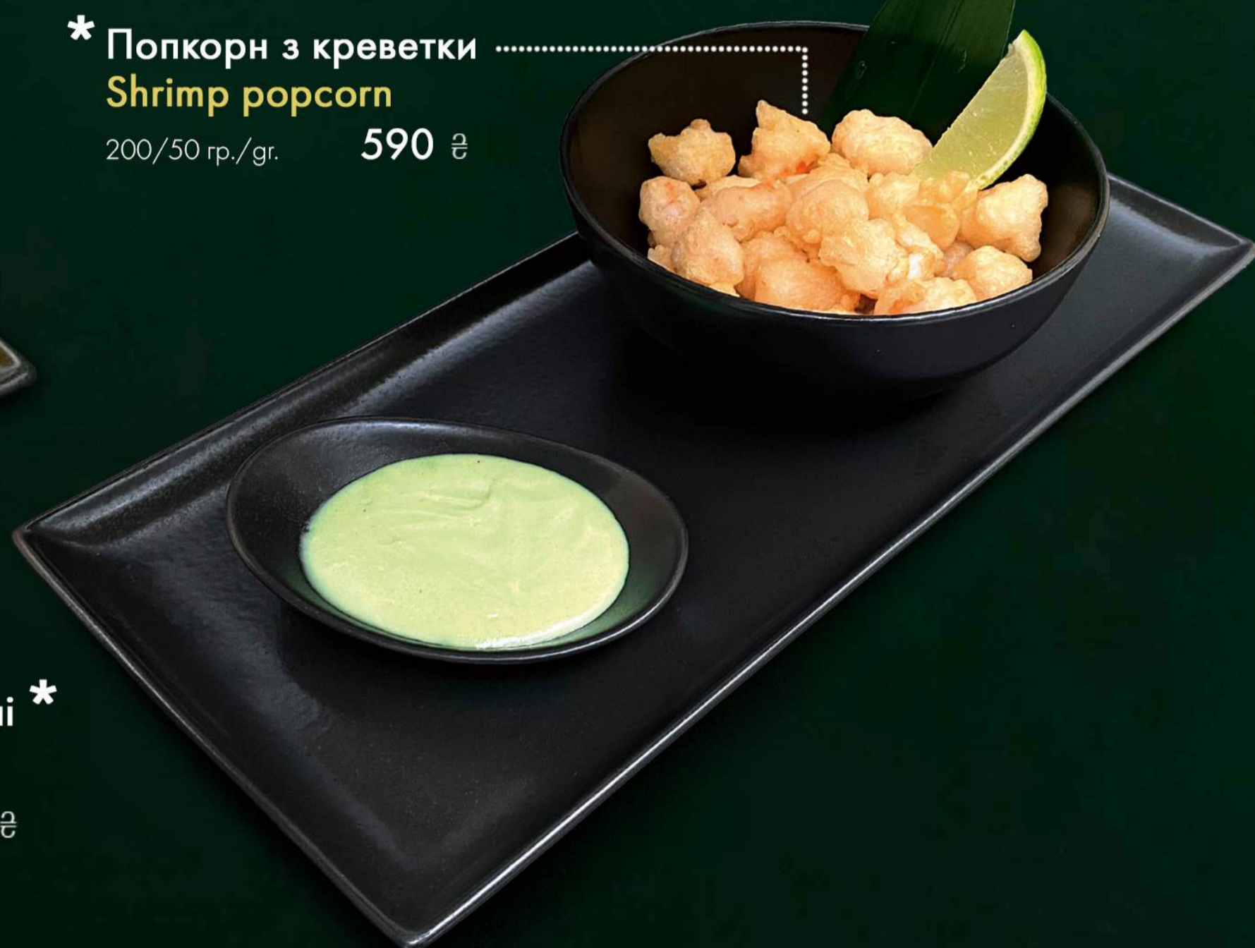
* Попкорн з креветки Shrimp popcorn 200/50 гр./gr. 590 ₴