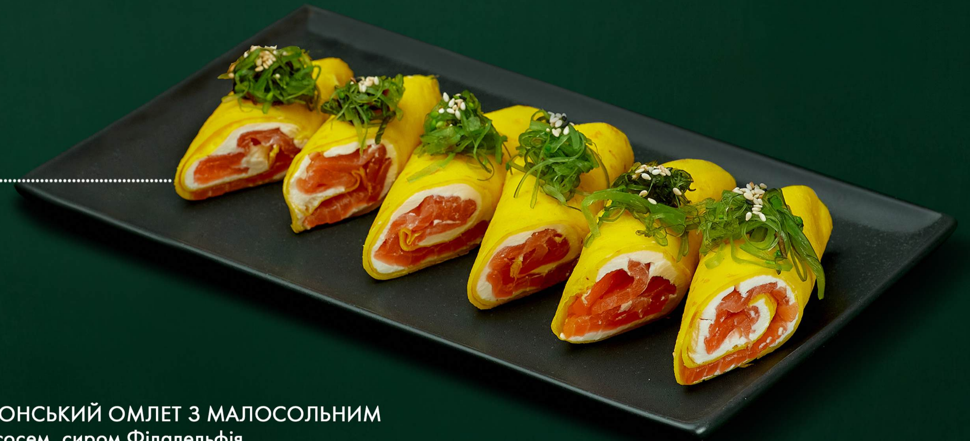
ЯПОНСЬКИЙ ОМЛЕТ З МАЛОСОЛЬНИМ лососем, сиром Філадельфія і Хіяші Вакаме Japanese omelet with low-salt salmon, Philadelphia cheese and Hiyashi Wakame